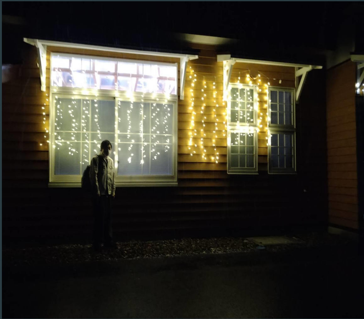
駅舎へのイルミネーション装飾