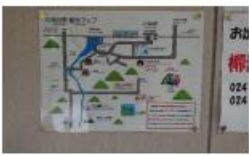
滝谷駅の観光マップ

郷戸駅と滝谷駅に、観光マップを設置しました。無人駅で周辺案内図がありませんでしたので、作成しました。皆様も魅力溢れる、郷戸・滝谷駅で途中下車の旅をしてみてください。