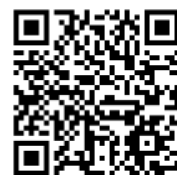
▲クマの目撃マップ