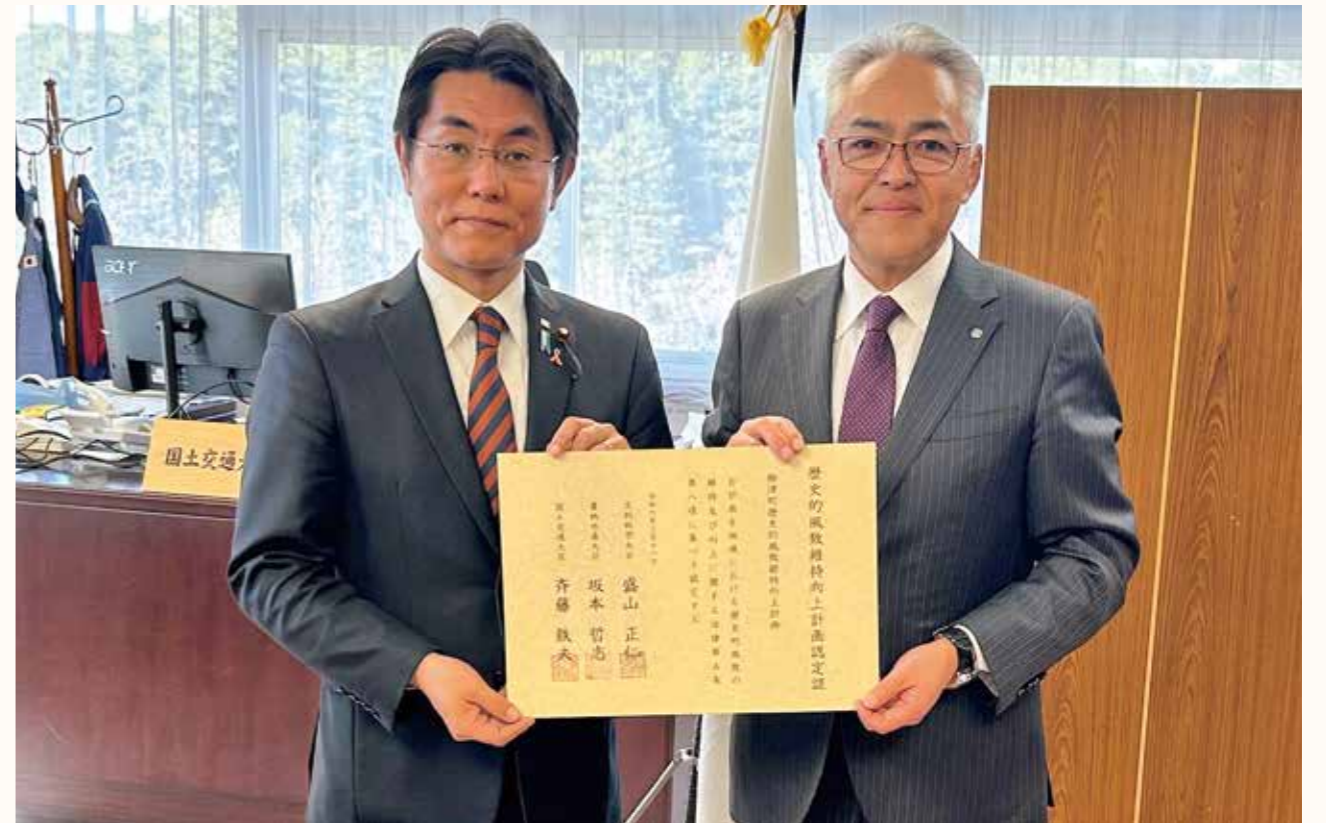
▲認定式の様子(左：石橋国土交通大臣政務官 右：小林町長)

3月18日に、本町の歴史や文化を活かしたまちづくりを推進するために、歴史まちづくり法に基づいて策定した柳津町歴史的風致維持向上計画が国(文部科学省、農林水産省、国土交通省)の認定を受けました。本町の認定は全国で94番目、福島県内では7番目の認定となります。また、福井県坂井市も同日に認定を受けています。