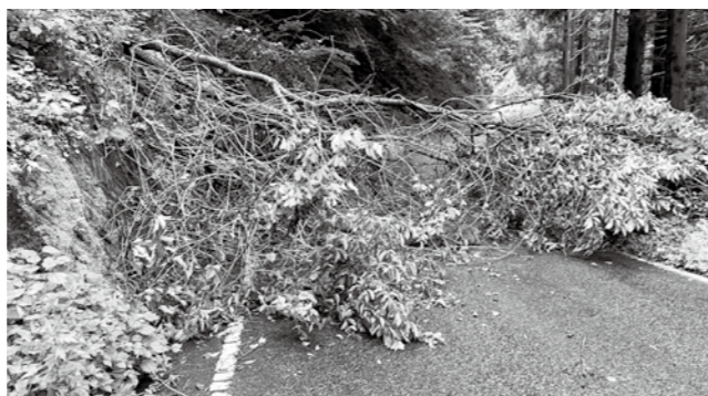
☎ 建設課建設係 TEL0241-42-2117

道路にはみ出した樹木等が原因で、カーブミラーが見えない、歩道が通れない又は通行車両が損傷することもあります。はみ出した樹木等が原因で事故が発生した場合、樹木の所有者は管理責任を問われることがありますので、所有地内の樹木の適正な管理をお願いいたします。