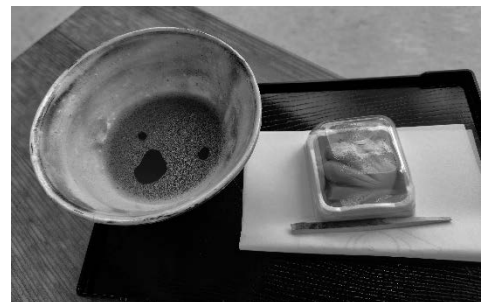
▲10月に実施した駅茶会の様子

会津柳津駅舎「cafe あいべこ」において、2日間限定でお抹茶と和菓子のセットを数量限定で提供を行う予定です。お近くにお越しの際は、お気軽にお立ち寄りください。