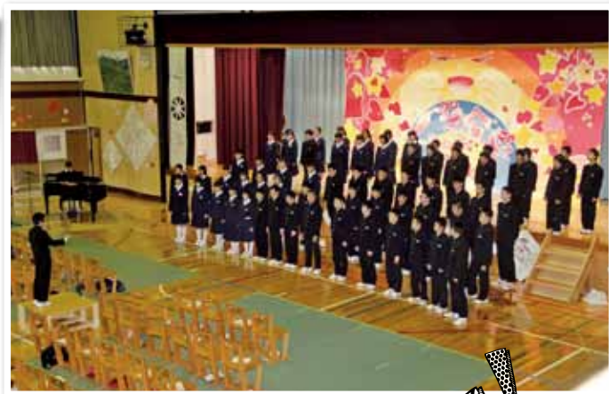
柳津中学校閉校記念式典の様子