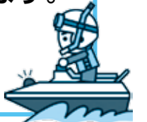
図 会津坂下消防署柳津出張所 Tel 42 - 2150