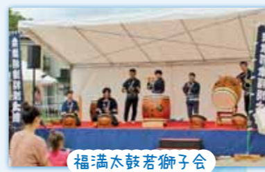
福満太鼓若獅子会