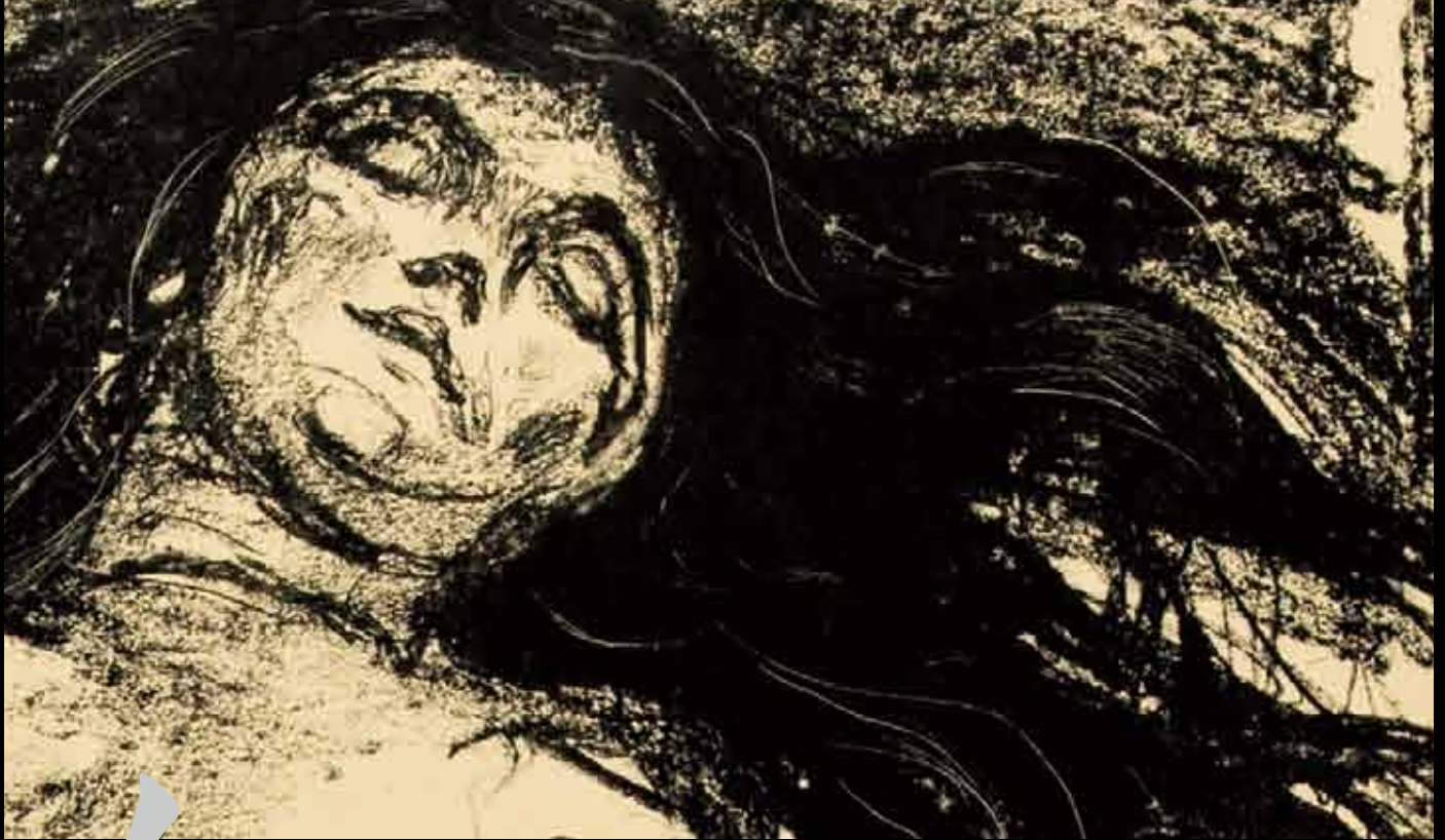
Reclining Woman (Big Madonna) / リトグラフ 1930年 © Munch Museum / Munch-Ellingsen Group / BONO 2017 (国立西洋美術館蔵)