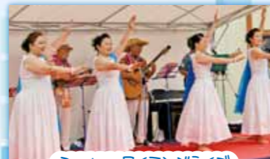
モバイル・ハワイアンズライブ