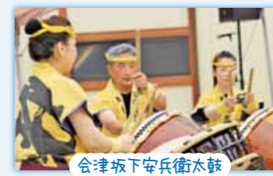
会津坂下安兵衛太鼓