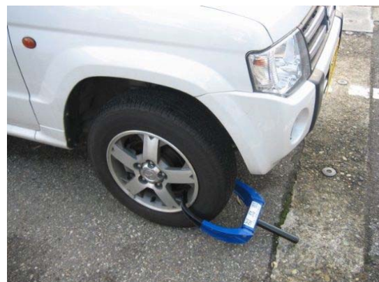
車の差押の様子（例）※タイヤロック