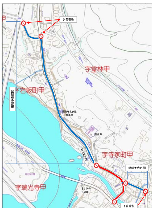
やないづまちなか歩行者天国 交通規制図