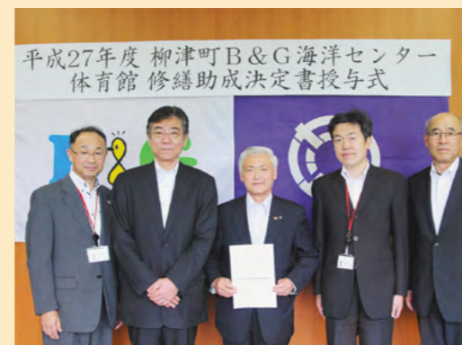
平成27年度 柳津町B & G海洋センター体育館 修繕助成決定書授与式