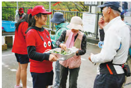
おもてなしに参加者は大満足の様子

コース中ではあわまんじゅうや旬の野菜、抹茶、和菓子などが振る舞われ、参加者は元気をもらい、気持ちを新たにゴールへ歩を進めました。