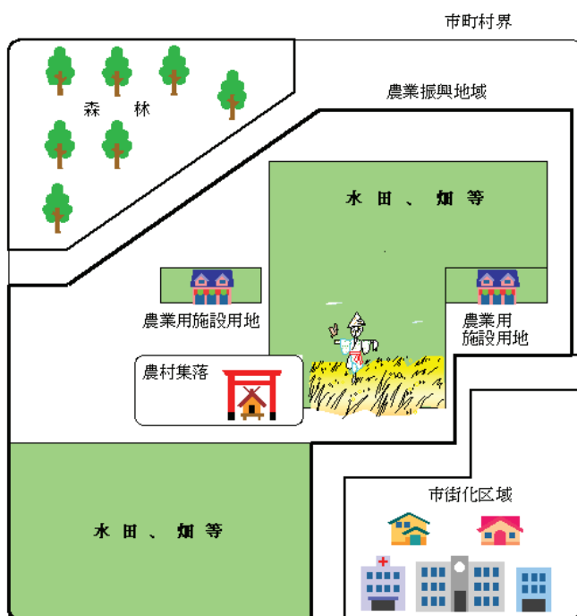
○ 農業振興地域のイメージ図

農地以外の用途で利用する場合は、まず市町村が農業振興地域整備計画を変更することにより当該農地が農用地区域から除外され、その後に農地転用許可を取得しなければなりません。