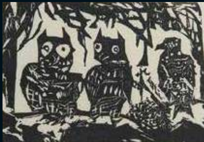
紐育にて／棟方志功 1959年頃 木版 In New York