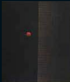
一つのさくらんぼ／浜口陽三 1962年 メゾチント A Cherry