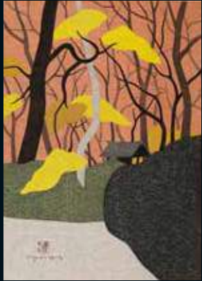
秋の嵯峨 京都／齋藤清 1974年 木版 Autumn in Saga Kyoto