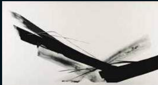
未来へ／篠田桃紅 1986年 リトグラフ、彩色（シルバー） To The Future