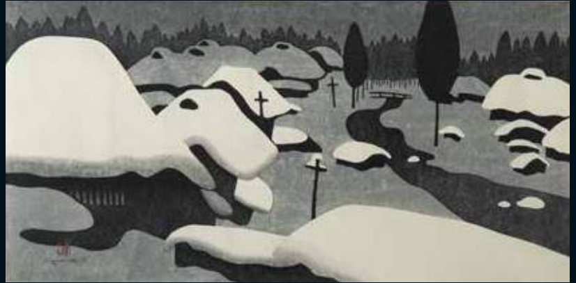
会津の冬 (35) 八木沢／齋藤清 1978年 木版 Winter in Aizu (35) Yagisawa