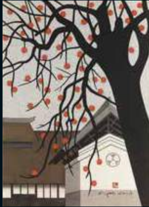
柿の会津 (38)／齋藤清 1996年 木版 Persimmons in Aizu (38)