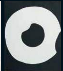
白い円／吉原治良 1969年 リトグラフ Shiroi En (White Circle)