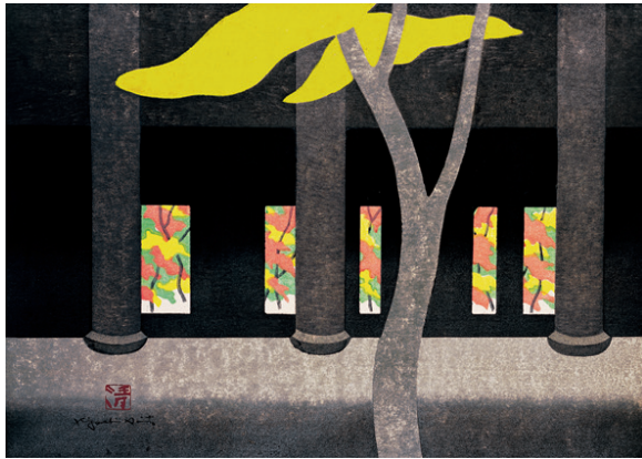
門 南禅寺 京都 1974年 紙・木版 Gate, Nanzen-Ji, Kyoto

2017年、アニバーサリー・イヤーですから、斎藤清の代表作「会津の冬」や「凝視」シリーズだけではありません。いままでほとんど表舞台に出て来なかったものの、世界のコアなファン層からは根強い支持を得ていた作品にもフォーカスした文字通りの「BEST OF THE BEST」展。新しい斎藤清ワールドの再発掘にもつながるはずです。