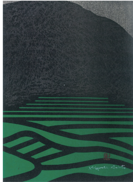
たんぼ 1962年 紙・木版 Tanbo(Rice Field) 福島県立美術館蔵