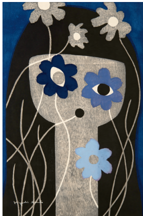
AUTUMN 1950年 紙・木版 AUTUMN 個人蔵