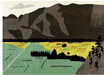
移りの南会津 1980年 紙・木版 The Harvest season in Minami Aizu