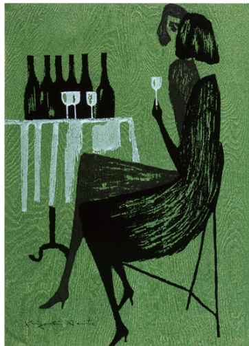
パーティ 1963年 紙・木版 Party 福島県立美術館蔵