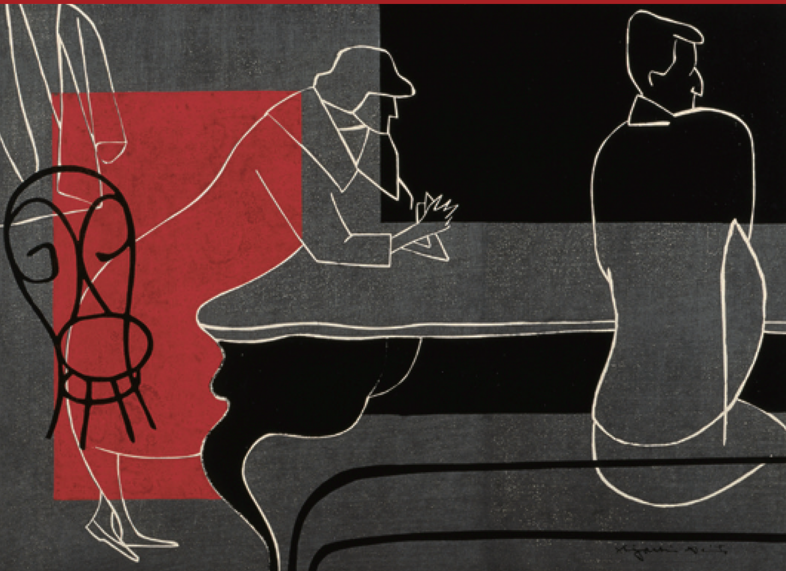
Paris(5) 1961年 紙・木版 福島県立美術館蔵