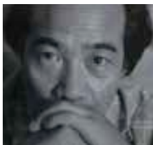
斎藤 清 Kiyoshi Saito

1907年(明治40年)福島県会津に生まれる。安井曾太郎氏の木版画作品に触発され、木版画制作へ傾倒。1951年、サンパウロビエンナーレ展に出品された〈凝視(花)〉が在サンパウロ日本人賞を受賞。戦後日本人として初の国際展での受賞となり、日本の現代版画の素晴らしさと斎藤清の名を世界中に広めることとなった。以後、国内外で数多くの栄誉に輝き、1995年、文化功労者に顕彰される。1997年、永眠。享年90歳。