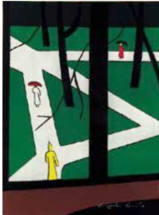
雨のミシガン 1956年 紙・木版