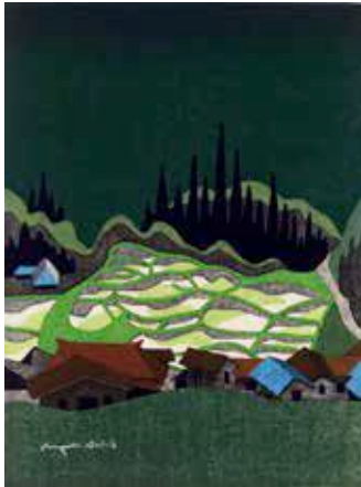
さつきの会津(7) 1993年 紙・木版