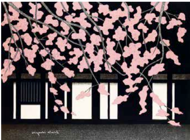
らまん(鎌倉) 1993年 紙・木版