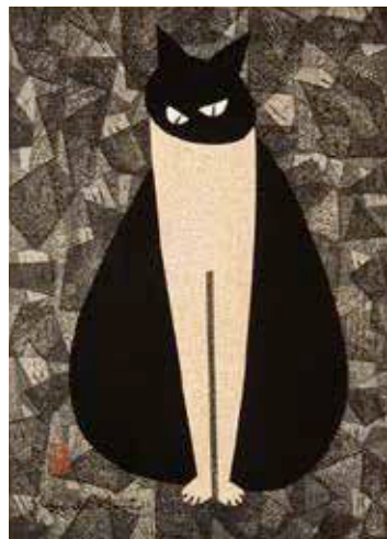
凝視 1962年 紙・木版