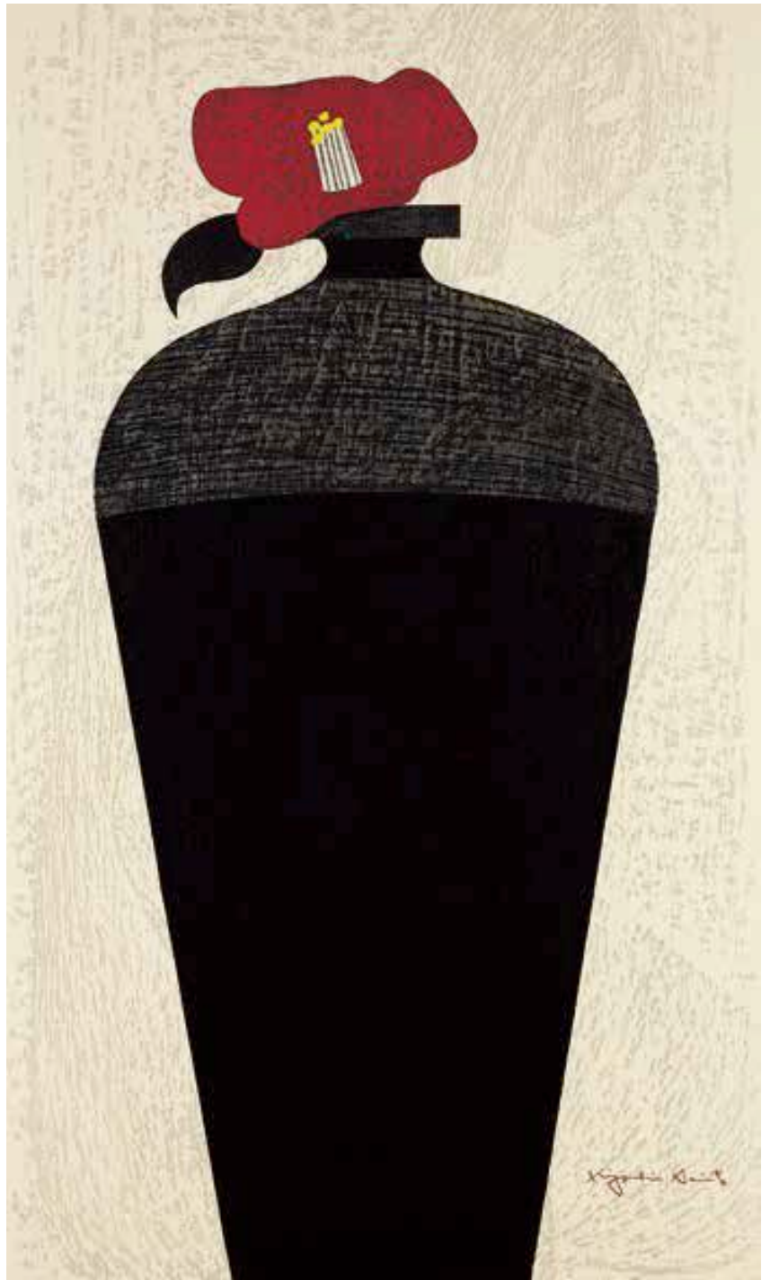
椿 1980年 紙・木版 Camellia