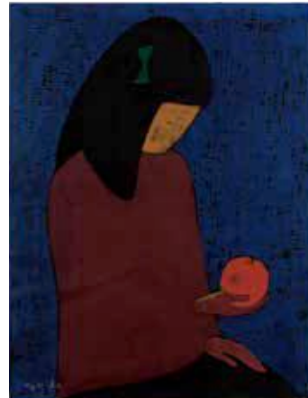
赤い実 1975年 紙・木版