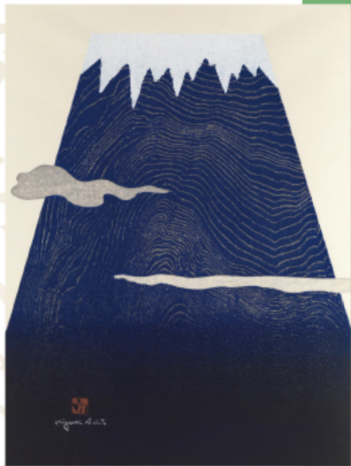
霊峰(15)晴天なり 1980年木版

【渋谷ヒカリエ】 〒150-8510 東京都渋谷区渋谷2-21-1 TEL.03(5468)5892 アクセス:東急東横線・田園都市線、東京メトロ半蔵門線・副都心線「渋谷駅」15番出口と直結。JR線、東京メトロ銀座線、京王井の頭線「渋谷駅」と2F連絡通路で直結。