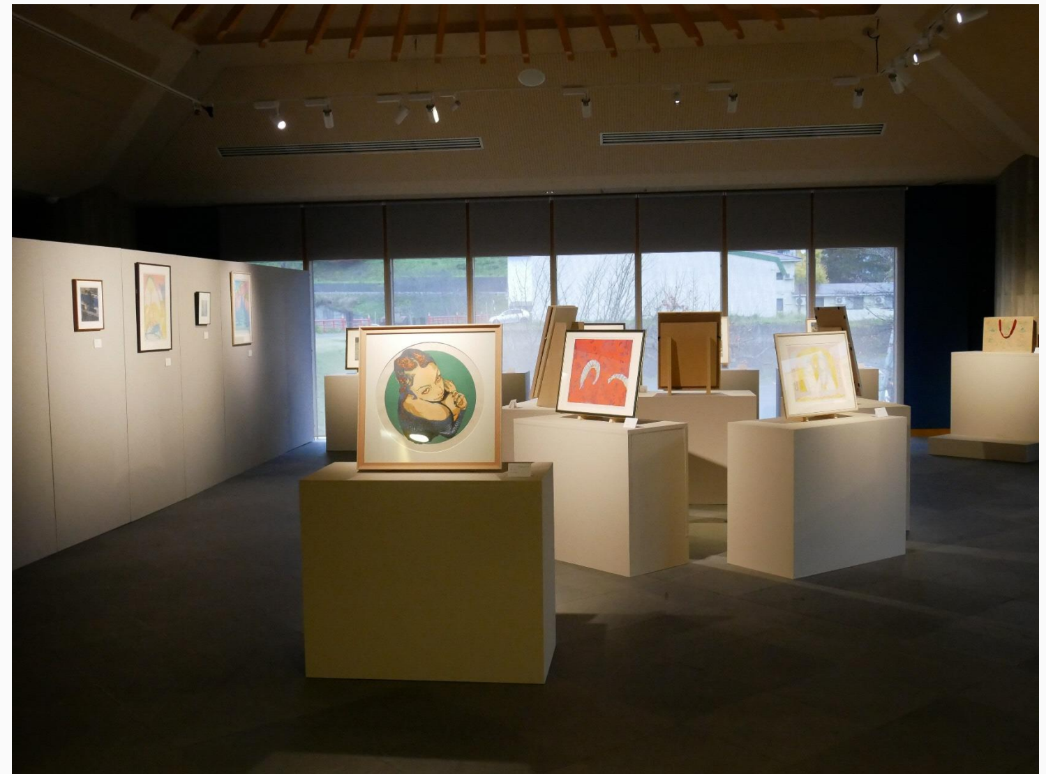
「筑波大学×日本大学×武蔵野美術大学 版画の現在地(いま)」 会場風景