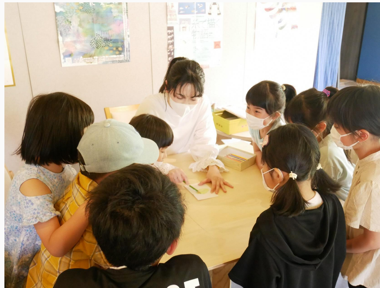
「想いを託して、フロッターージュ」の様子