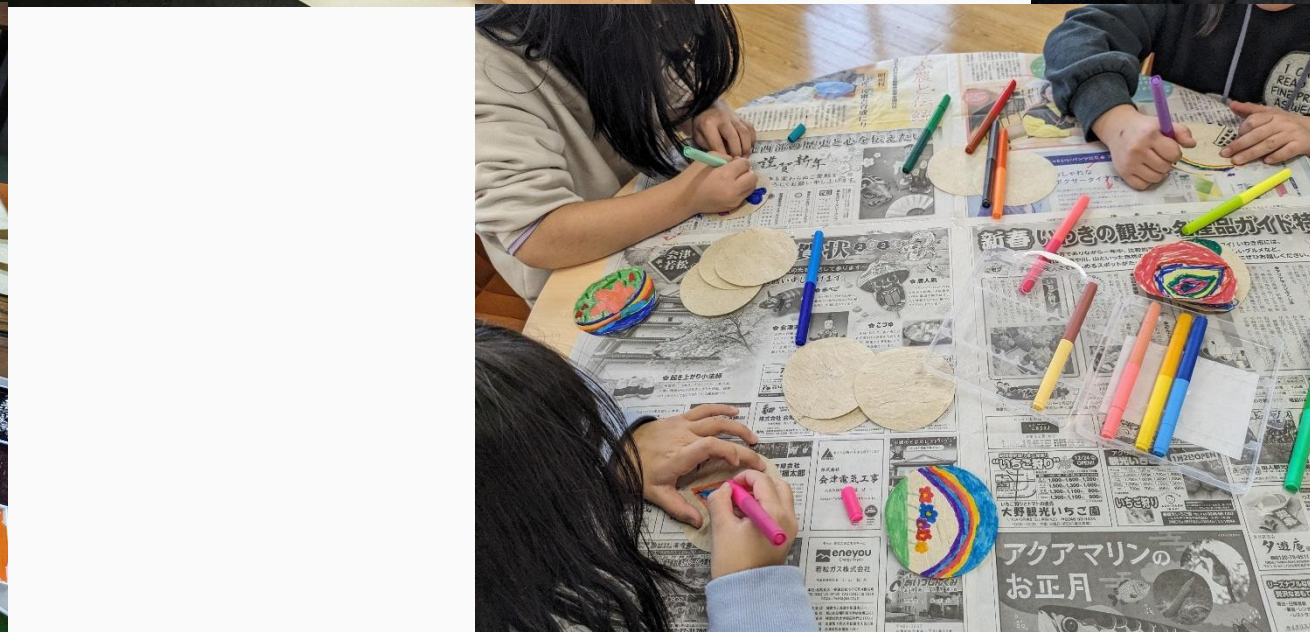
和紙を使ったものづくりワークショップのようす