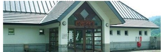
山村公園せいざん荘