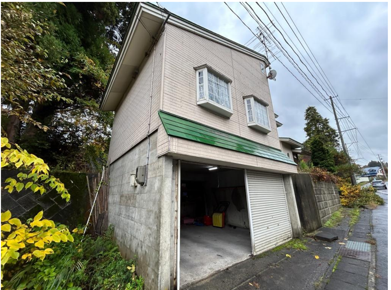
車庫の様子。普通車2台分ほどのスペースがあります