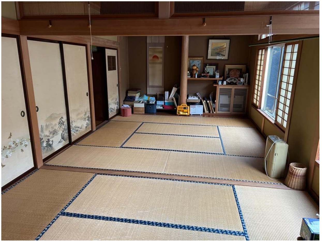
和室。広々と使うことも、ふすまで仕切って使うことも可能です