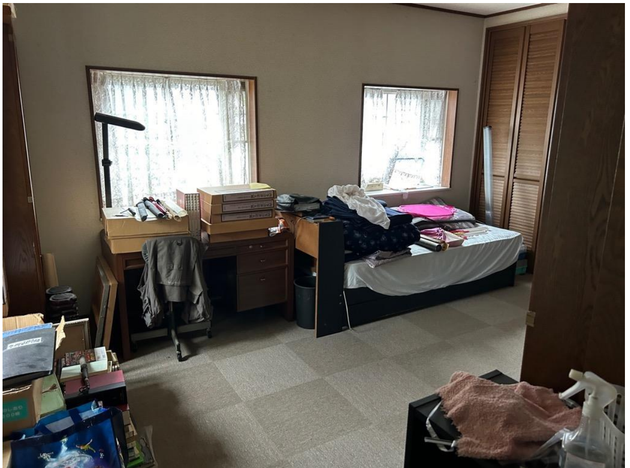
洋室も明るく利用しやすい空間です