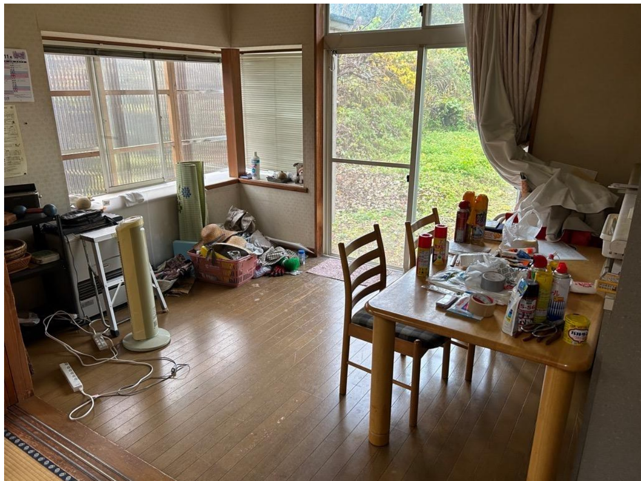
キッチンのリビング。日当たりが良く明るいです