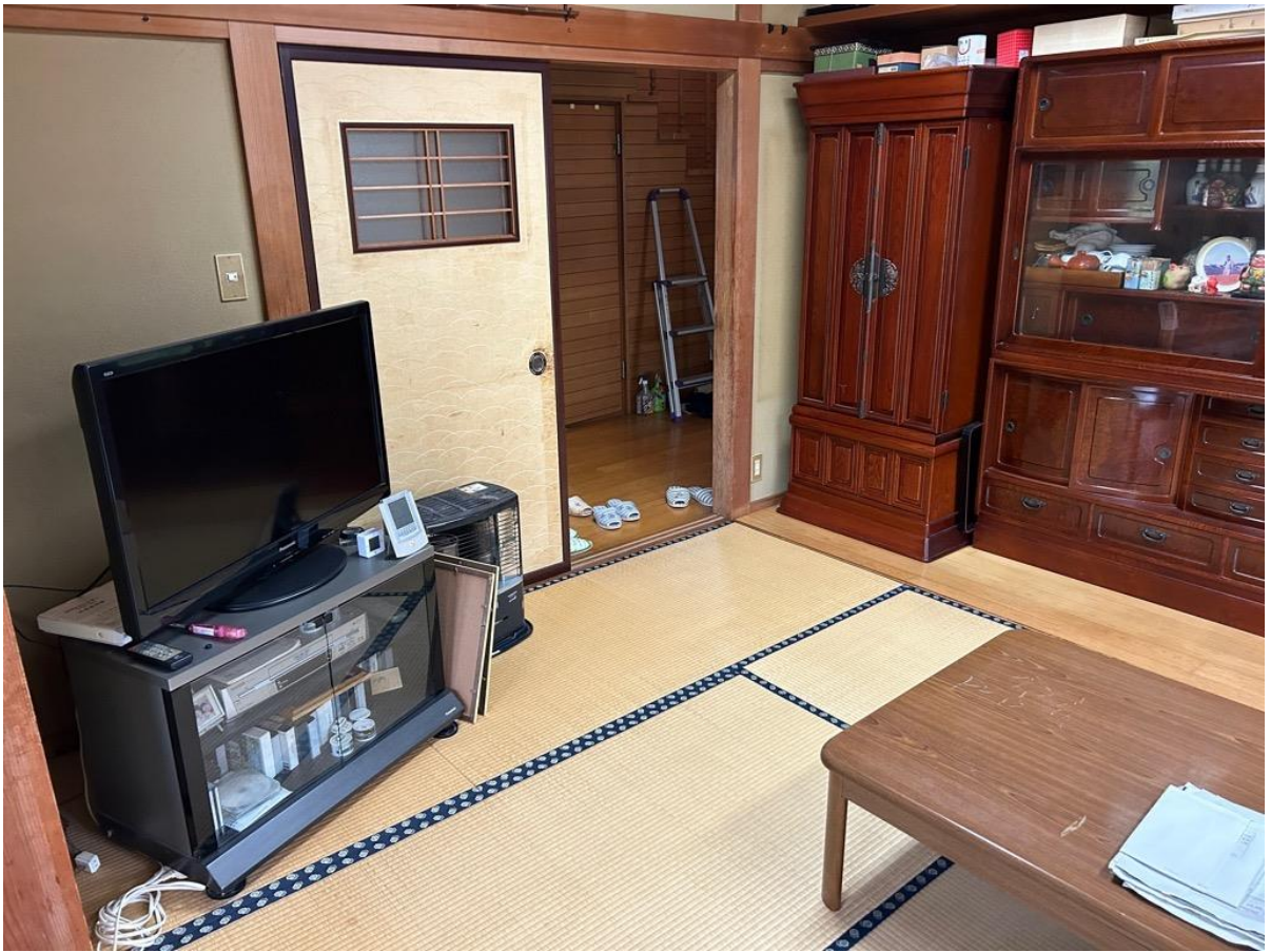
居間は畳7.5畳、板間2.5畳、計10畳の広々とした部屋です