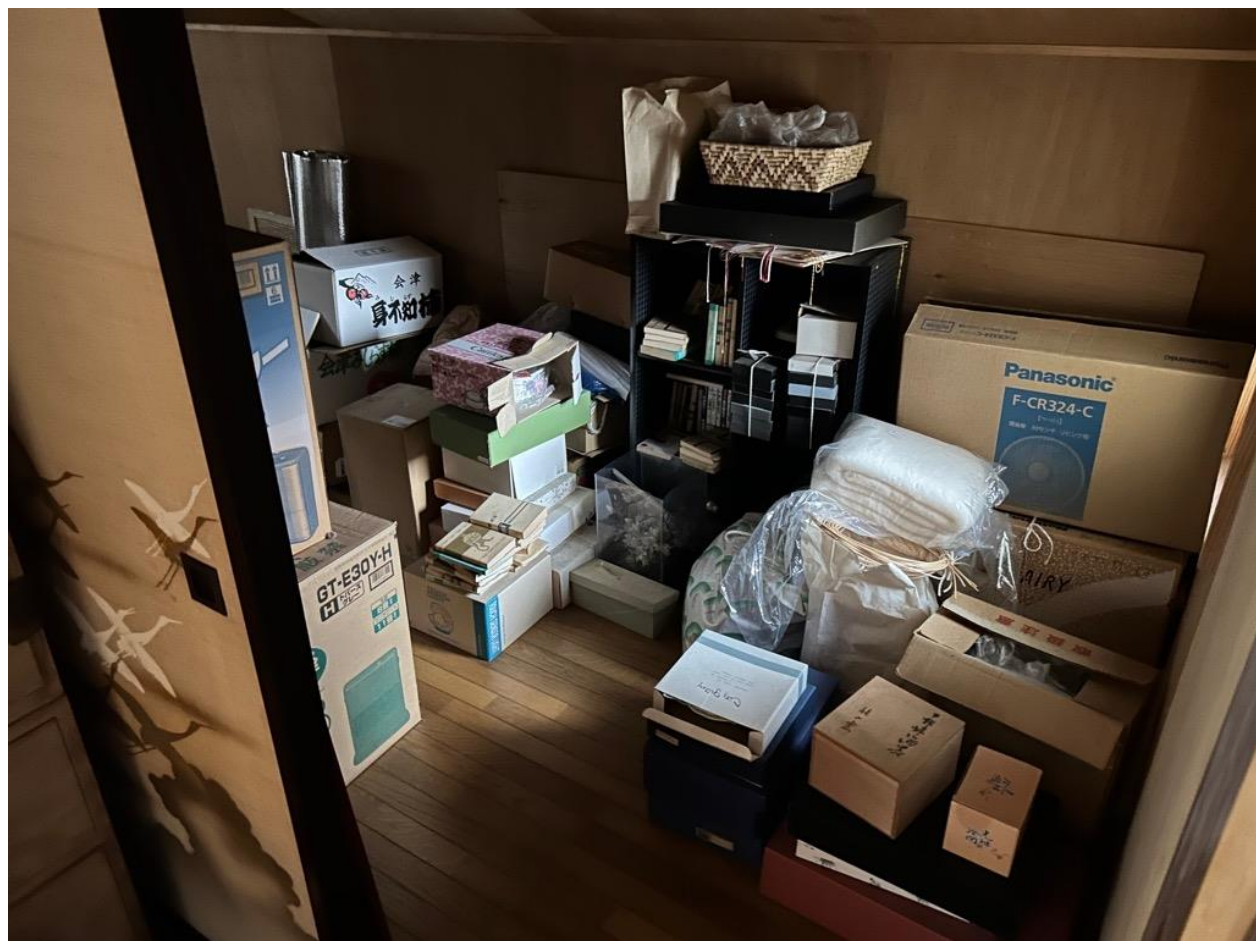
和室の収納スペース。十分なスペースがあり、使いやすくなっています。