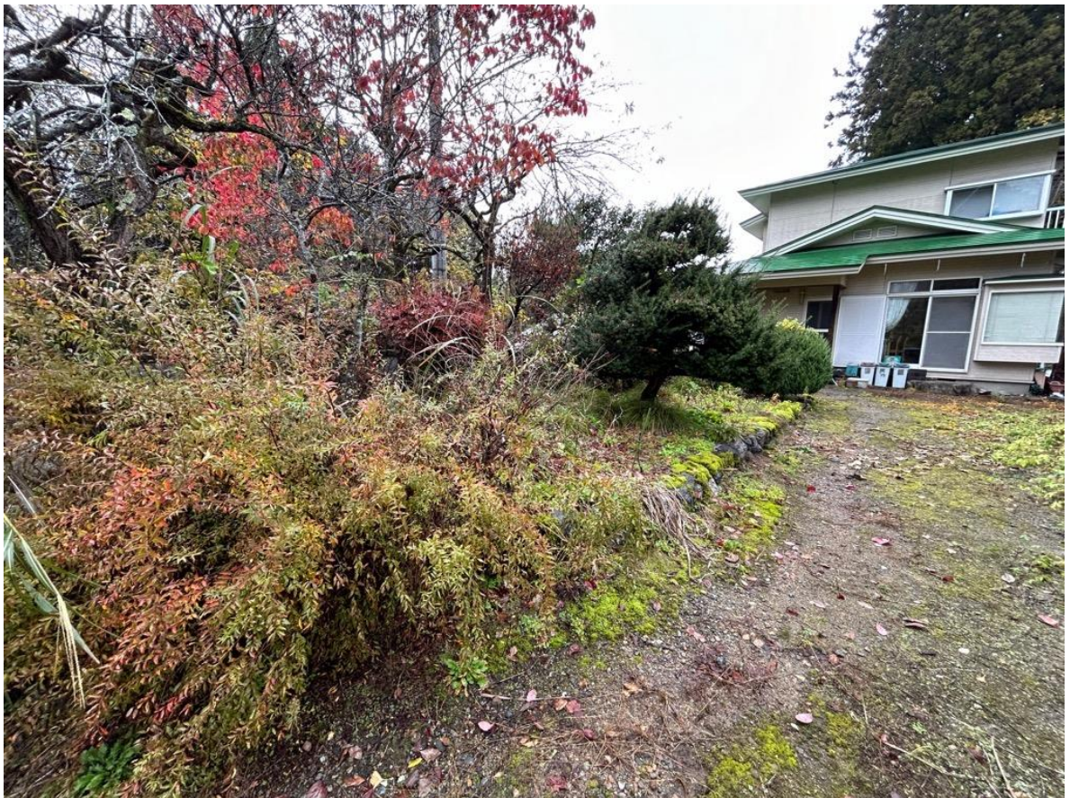
庭もついています