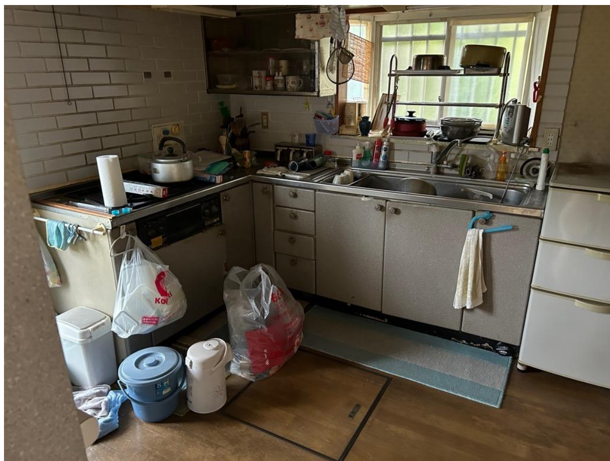
キッチンの流し台