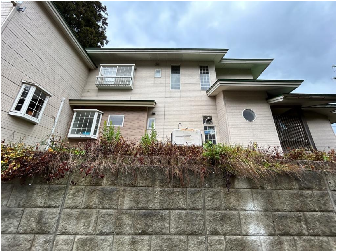
2階建ての民家です。半地下の車庫も付いています（築33年程度）