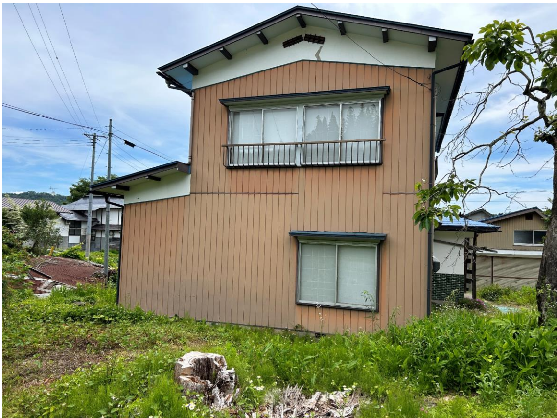
家の周りはきれいに管理されており、空き家となって間もないことから状態も良いです。