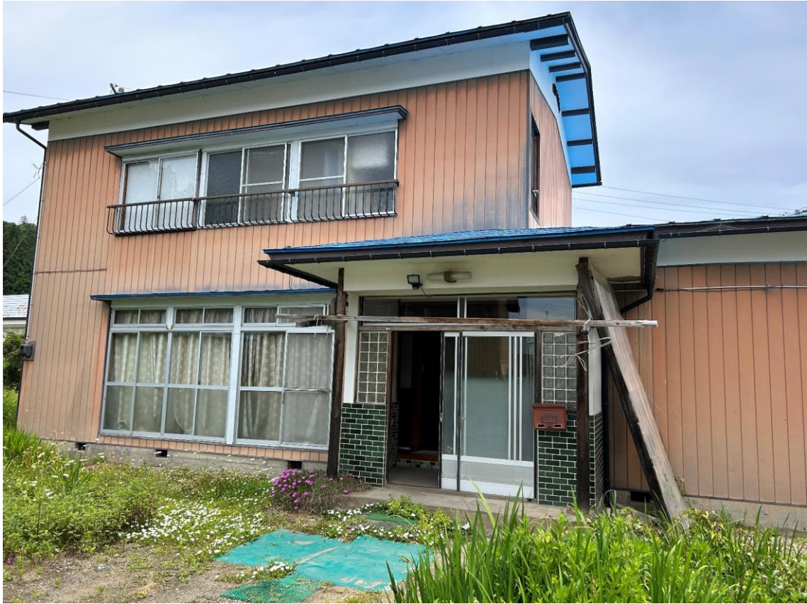
2階建ての民家です（築50年程度）