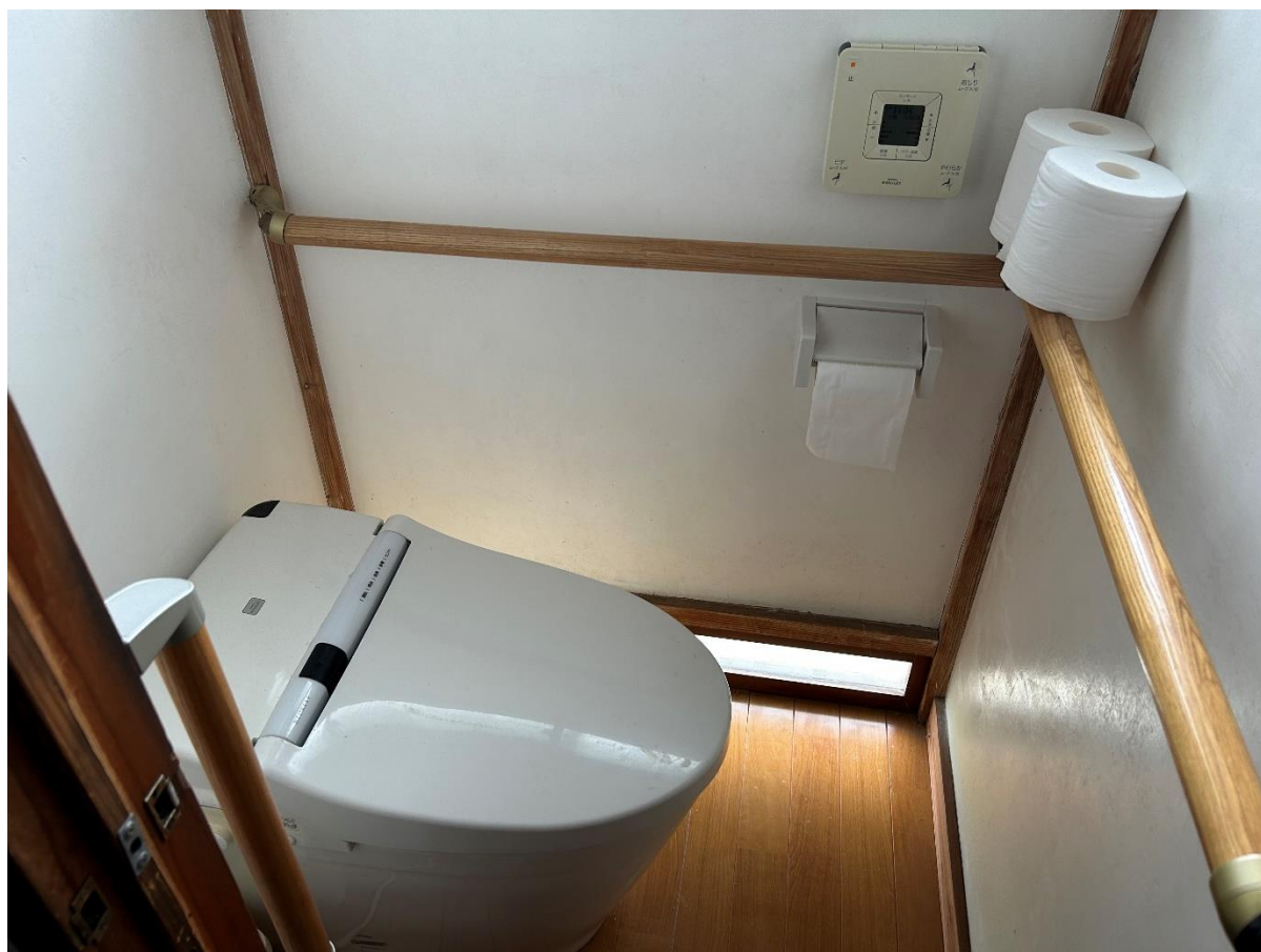
トイレ（洋式・大便器）