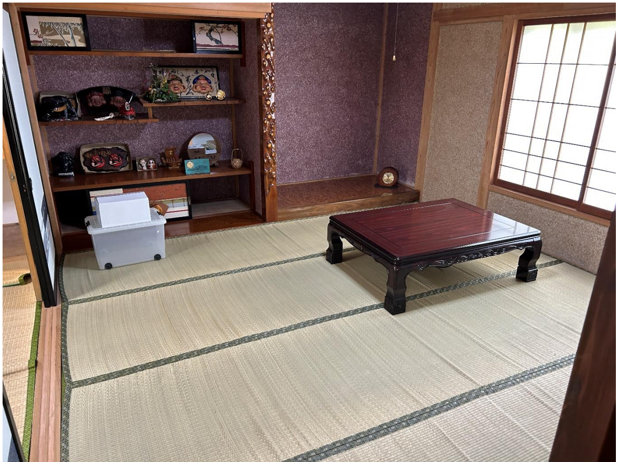
1階和室③。どの部屋もきれいに整理されています。