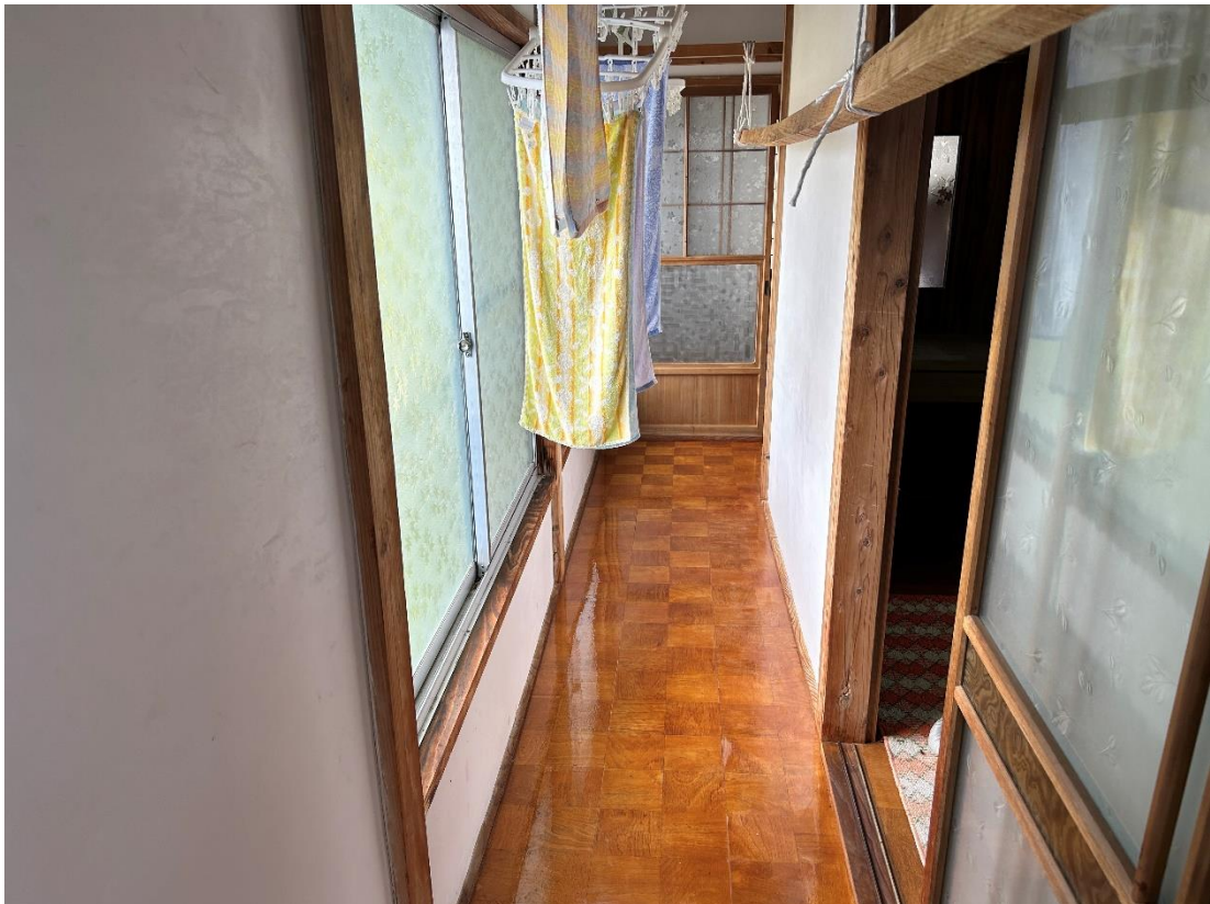
2階廊下 階段側から見たアングルです。