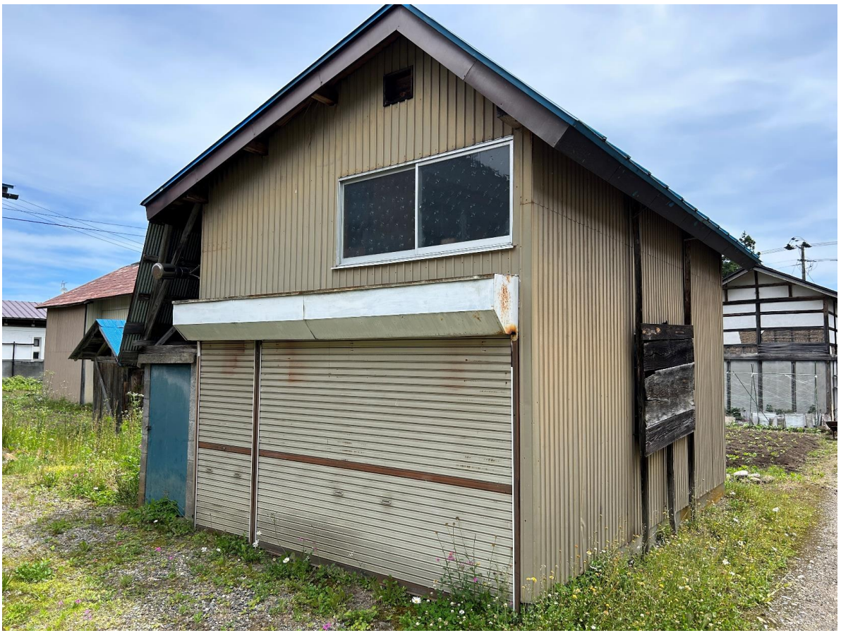
車庫や物置として使える小屋もあります。