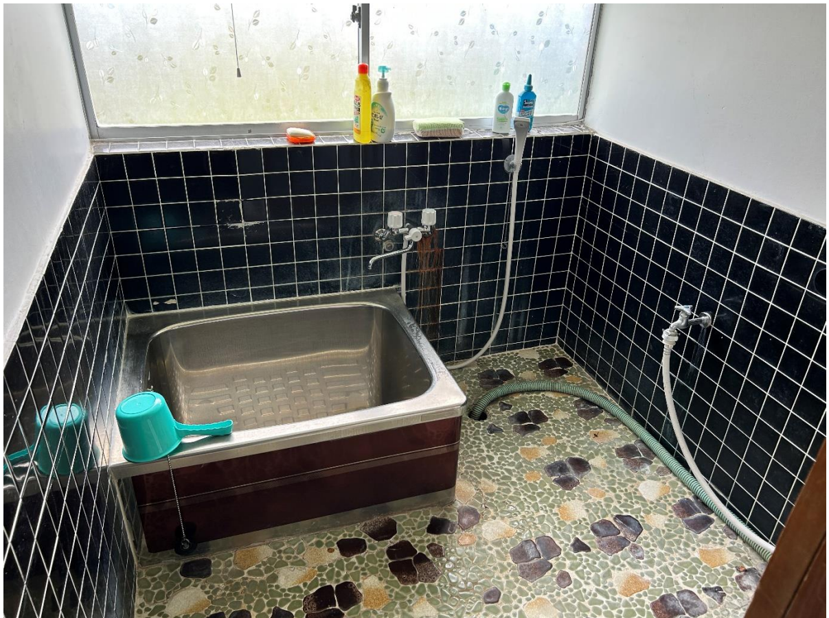
風呂場。洗面所の隣にあります。