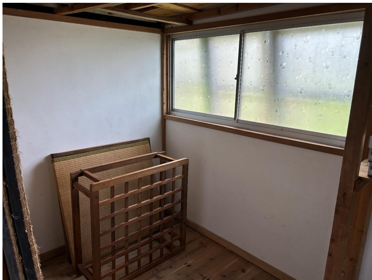
1階の奥には物置として使えるスペースもあります。